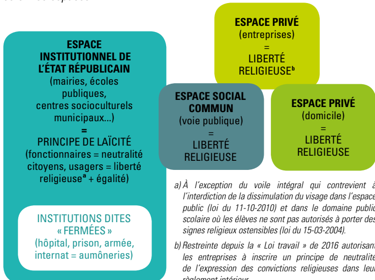
Schéma 1 – Cartographie de la laïcité : l'application du principe de laïcité selon les espaces

Ex. : un élève scolarisé dans une école publique ne peut pas porter de signes manifestant ostensiblement une appartenance religieuse. Les élèves internes peuvent librement pratiquer leur culte, en dehors des horaires d'enseignement, sous réserve des contraintes posées par le règlement de l'établissement.