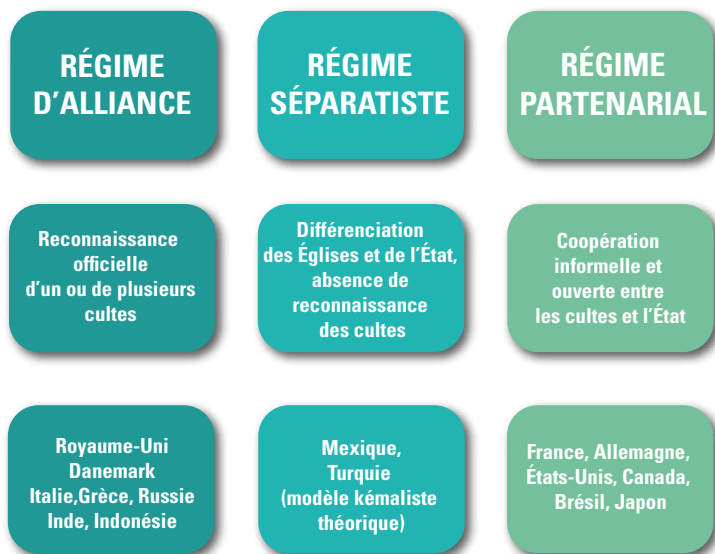
Schéma 3 – Typologie des régimes de laïcité dans le monde

Pour l'Union européenne (2017), les « régimes d'alliance » concernent le Royaume-Uni, le Danemark, l'Italie, l'Espagne, le Portugal, la Grèce, la Hongrie, les Pays-Bas, la Belgique, le Luxembourg, la Finlande, l'Autriche, la Bulgarie, Chypre, la Croatie, Malte, la Pologne, et la Slovaquie.