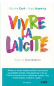
M.Cerf - M.Horwitz Préface R.Badinter Dessins Nono Dunod, 2022 3 e édition