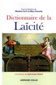
M.Cerf - M.Horwitz Intro de J-L Debré A.Colin, 2016 2 e édition