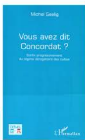
M.Seelig Débats laïques L'Harmattan, 2015